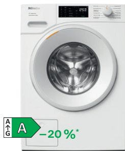
Lave-linge WSB 300-63 CH N° mat. 12708830 Livrables dès février 2025

Chez Miele, l'action durable et le développement d'appareils efficaces sont une tradition depuis plus de 125 ans. Nous testons nos produits pour obtenir des résultats exceptionnels et une longue durée de vie, de sorte qu'au lieu d'utiliser plusieurs appareils, vous n'en utilisez qu'un seul pendant de nombreuses années ( www.miele.ch/20ans ).