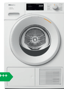
Sèche-linge TSC 600-43 CH N° mat. 12708940 Livrables dès février 2025